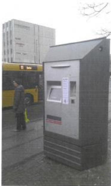
Viby Torv – automat 1001, i drift 17/12-2013

Billede af stationære billetautomater indsendt af Midttrafik: